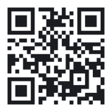
סרקו לאתר פרוייקט ילדי בית העץ

כיצד ננהג במצבים השונים ואיך נפתור בעיות? מה נעשה כשתהיה לנו התלבטות אישית? איך נפתור בעיות חברתיות? האם נדע מה לעשות כשניתקל במפגע סביבתי? למי נפנה כשנראה מישהו זר שזקוק לעזרה או לעצה?