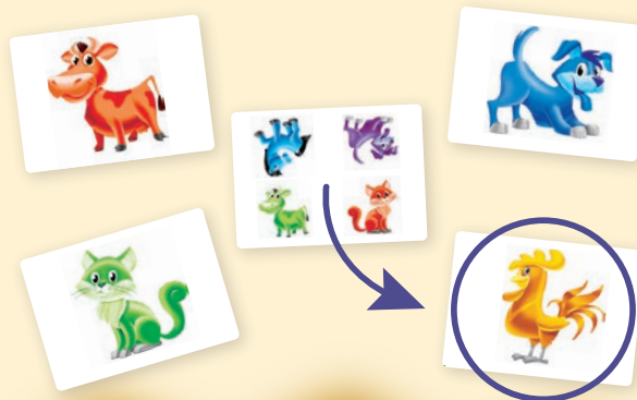
Figure out which animal and which color is missing and find it among the animal cards scattered about. Whoever finds the right animal first receives the herd card as a point. The player with the most cards at the end of the game is the winner!

On each of the herd cards, one of the five animals and one of the five colors is missing.